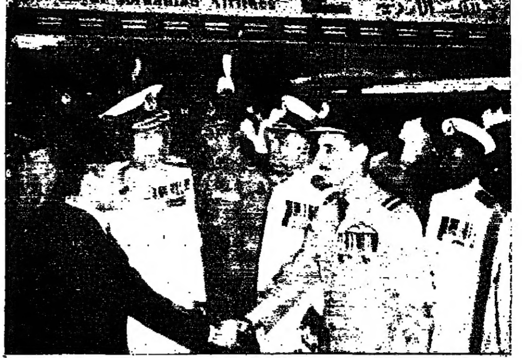
جلالة الملك العظيم مصافح مستقبليه من قادة القوات الباكستانية المسلحة